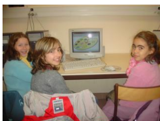
Des élèves de 6 ème et de CM de Saint Joseph de Gouesnou