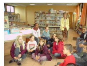
Les CM de Notre Dame de Tourbian